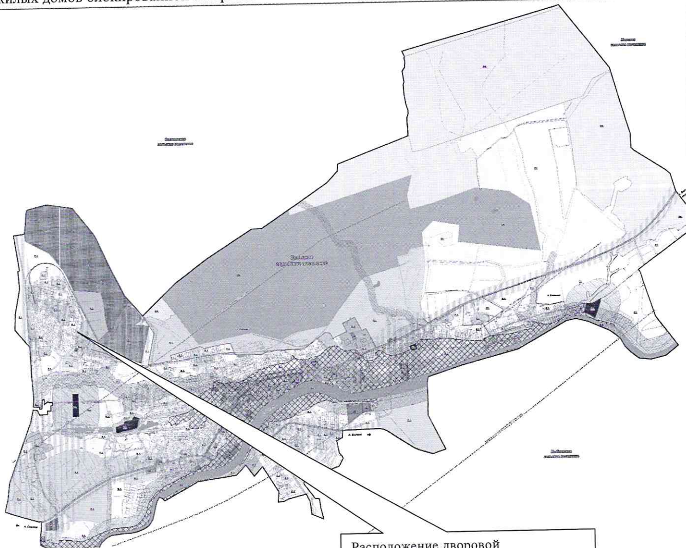
Расположение дворовой территории на схеме Солецкого городского поселения

Данная зона выделена для обеспечения правовых условий формирования кварталов комфортного жилья на территориях застройки при невысокой плотности использования территории и преимущественном размещении многоквартирных домов не выше 3 этажей и многоквартирных жилых домов блокированной застройки.